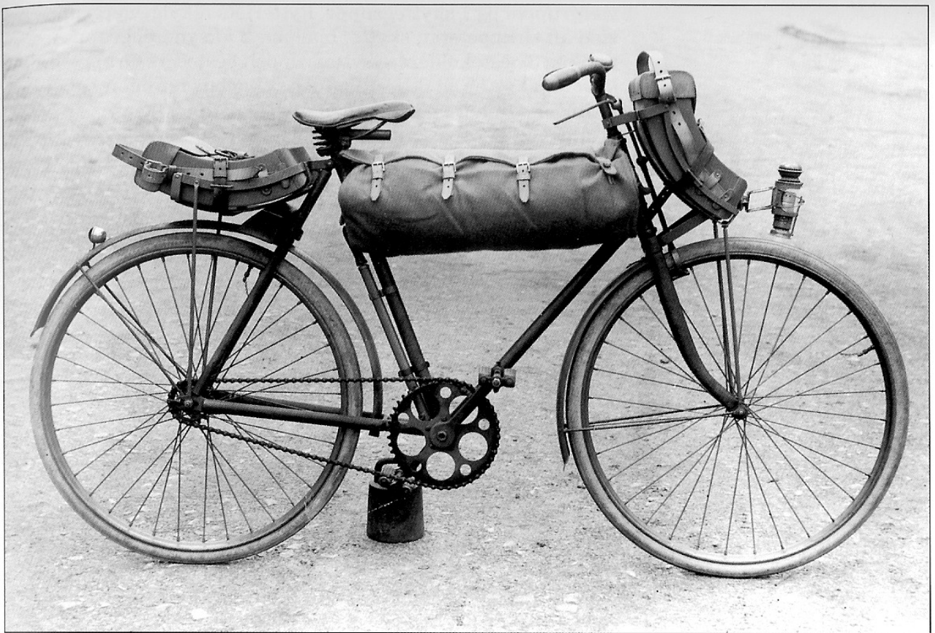
Pakning af cykel med to ammunitionstaskebærere og mantelsæk, således som foreskrevet for Rytteriets cyklisteskadron. Fodfolkets cyklistregiment benyttede tilsyneladende ikke den forreste ammunitionstaskebærer. (HTK 2393, HTK negativarkiv TM)

Ligesom i den tidligere hærlov indeholdt loven af 1937 også bestemmelser for oprettelse af bevogningsafdelinger (§87), og det fremgår af den liste over regimente og deres garnisonering, som Krigsministeriet opstillede som følge af dets bemyndigelse til at bringe Hærens organisation i overensstemmelse med den nye lov, at der ved hvert fodfolksregiment, undtagen Livgarden og 6. Regiment, blev opstillet en forstærkningsbataillon.