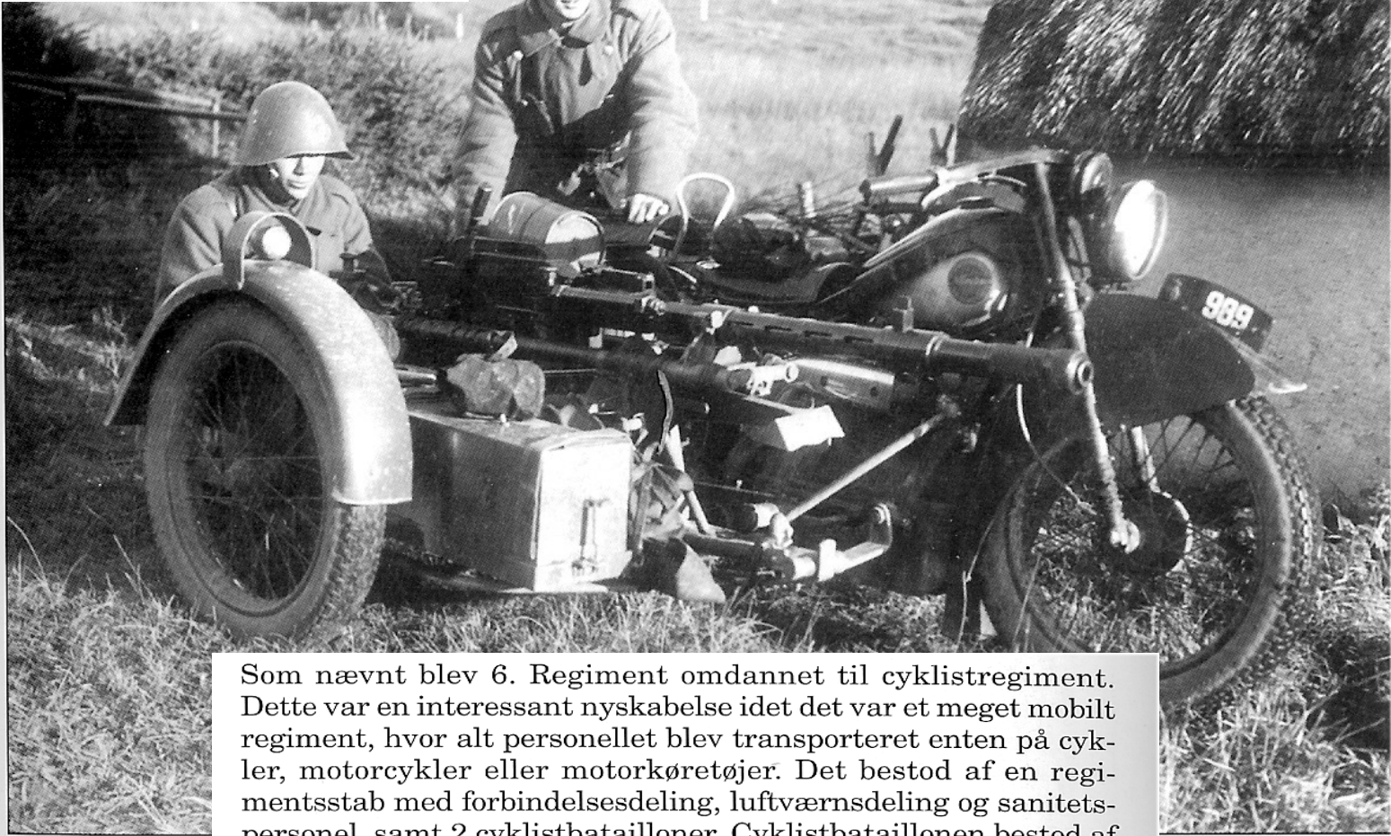
20 mm Maskinkanon M.1938 i Feltlavet på motorcykel "Kanon- maskine" i skudstilling. (Postkort fra ca. 1940)