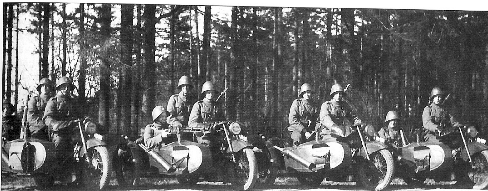
Rytteriets motorcyklistgruppe. Mandskabet er tilsyneladende fordelt lidt andeleles på motorcyklerne end det er forklaret i teksten, idet der er tre mand på skyttemaskinen.