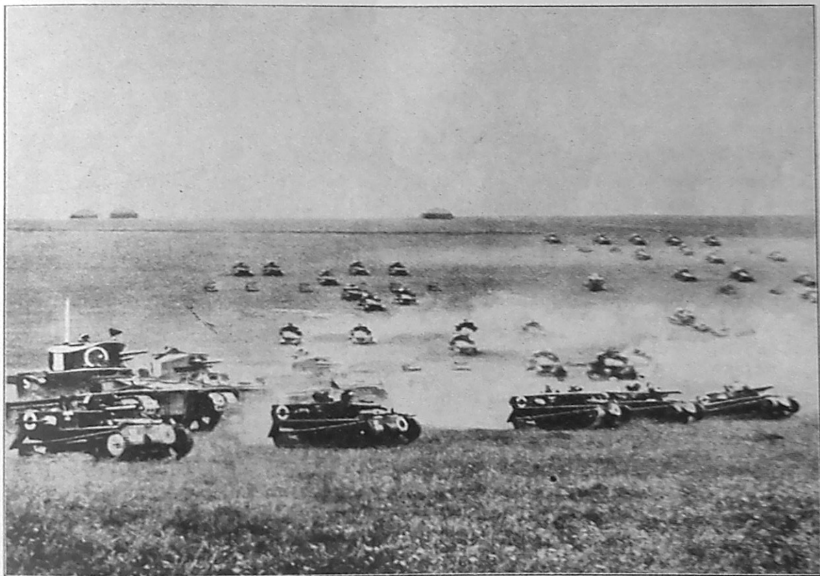
Engelske Panservogne gaar til Angreb.

Moderne Tanks er forsynede med et Staalpanser paa fra 6—7 til henimod 30 mms Tykkelse, deres Hastighed er i gunstigt Terrain ca. 20 km i Timen, paa Landevej dog betydelig større. Bevæbningen bestaar i Reglen af Kanoner af Kalibe-