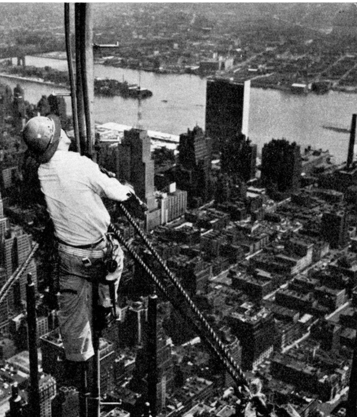
Fotografi fra bogen Amerika i billeder, 1952, der viser New York set fra oven. Bogen havde til formål at give danskerne et indtryk af USA, primært på baggrund af et billedmateriale der var stillet til rådighed af De forenede Staters Informationstjeneste.