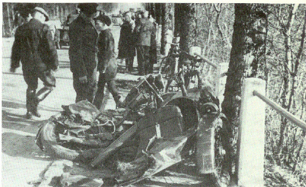
Nedkørt ammunitionsmotorcykel (Nimbus) fra 20 mm kanonen,

nærmede sig hastigt og tromlede 20 mm kanonen ned sammen med dens ammunitionsmotorcykel. Endvidere blev to motorcykler skudt i »sænk«, hvoraf den ene udbrændte totalt. En sygepasser, som havde siddet på bagsædet af den ene motorcykel, blev hårdt såret. Vi fik ham hentet, men havde intet at forbinde ham med, så vi anlagde en »forbinding« med bl.a. en lædermotorhjelme!