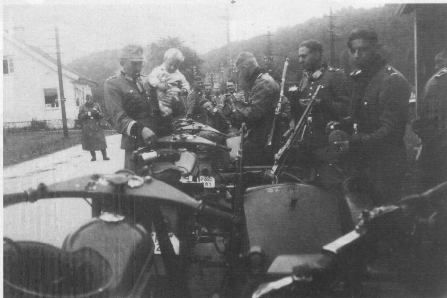
Under krigen beslaglagde den tyske værnemagt mange Nimbus motorcykler, og en del af dem endte i Norge, og som det ses, fulgte Madsen rekylgeværet med.

Det lette rekylmaskingevær blev i 1938 fulgt op af et tungt maskingevær, kaldet 20 mm Madsen M/38. Det kunne leveres med forskellige former for affutage, altså lavet eller stativ, om man vil. Det var muligt at få kanonen med enten felt-, luftværns-, sidevogns- og marineaffutage. Det var et meget effektivt våben, og det kunne skyde med flere forskellige projektiler, som alle havde en stor anslagsenergi. Skød man for eksempel med panserbrydende projektiler, var mundingshastigheden 790 meter i sekundet for det 154 gram tunge projektil, som på 100 meters afstand kunne gennembyrde 43 mm kromnikkelstål. Monteret på Nimbus motorcyklens sidevogn var det hurtigste og mest effektive våbensystem, den danske hær rådede over i 1940. Det beviste sit værd tirsdag den 9. april 1940, hvor der var kampe mellem danske og tyske styrker. 20 mm kanonerne uskadeliggjorde ikke mindre end 11 pansrede køretøjer og to Panzer 1 kampvogne. Det kunne skyde direkte fra sidevognen, men trykbølgen var så voldsom, at det ødelagde Nimbus motorcyklens forlygteglas, så derfor blev det i reglen taget af sidevognen og placeret i lavetter, inden der blev skudt. Det lette Madsen rekylgevær var derimod beregnet til at skyde direkte fra sidevognen. Det sad i en pivot, og kunne betjenes både under kørsel og stilstand.