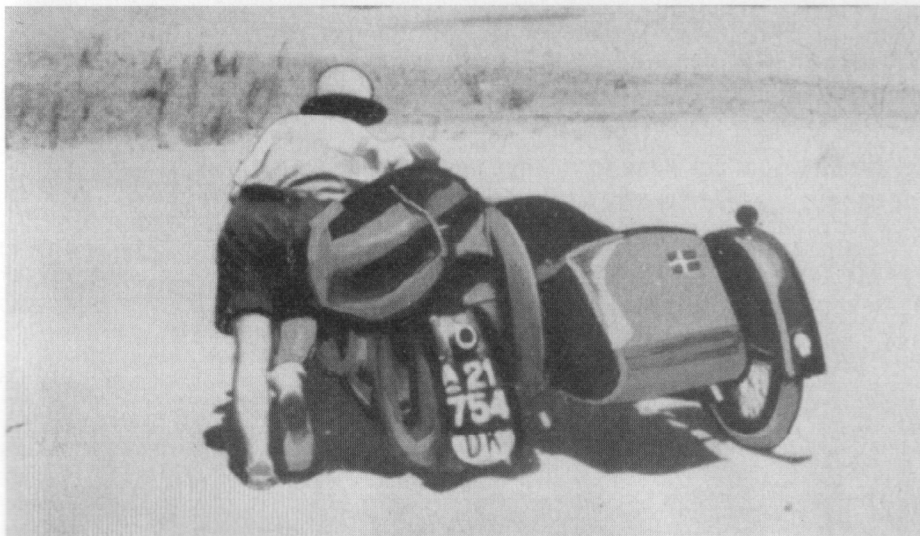
De to skuespillere måtte utallige gange skubbe motorcyklen gennem ørkensandet.