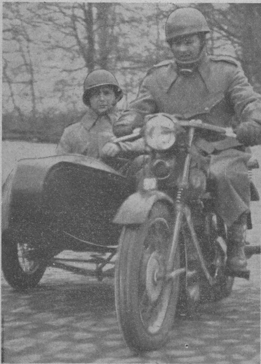
Motorordonnans-Ekvipage: Motorcykle med Sidevogn. Motorordonnanserne er Hjemmeværnets bedst udstyrede Folk, bekædningsmæssigt set. Udover den normale Udrustning faar de Styrthjelm, Pistol og Motor-Gamache udleveret Spidsbukser, Snørestøvler, r, -Handsker og -Briller.

som var en Konservesdaase, til at øse Sidevognen med. Nu benytter de Tiden til at sluge et Par af deres medbragte Klemmer, og den ene af dem savner slet ikke Drikke til Maden. Hans Madpakke har svømmet i Bundvandet, saa det er i sidste Øjeblik, han kan spise den som Smørrebrød — ellers maatte han have haft Ske til Øllebrød.