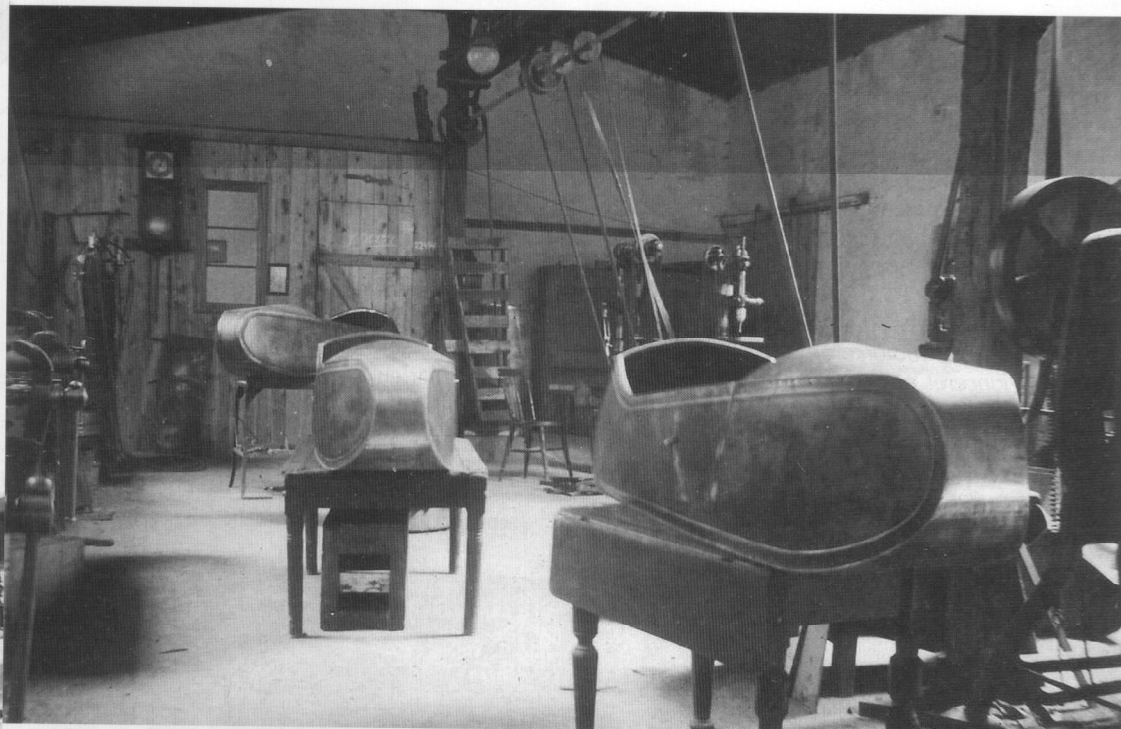
Her er det sidevogne til nogle af de første Nimbus motorcykler. Bemærk, at der er dør i sidevognskassen for at lette indstigningen. Billedet er taget i 1936.