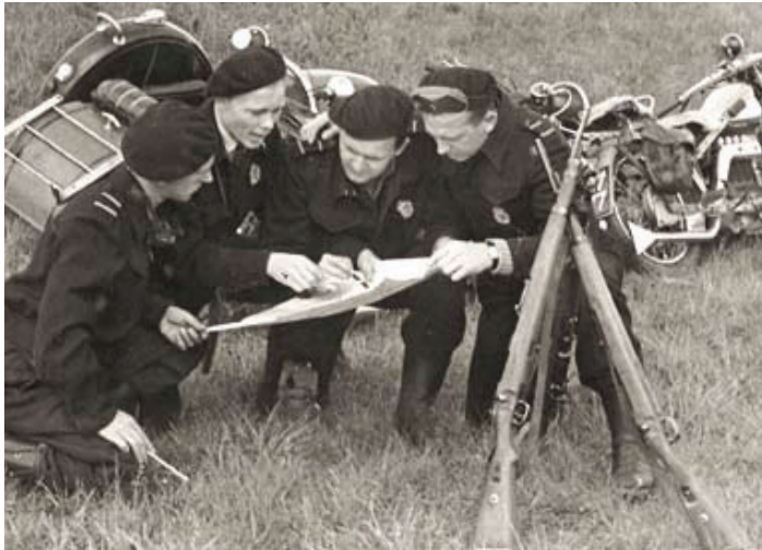
De ildsprudlende motorordonnanser poserer til ære for fotografen