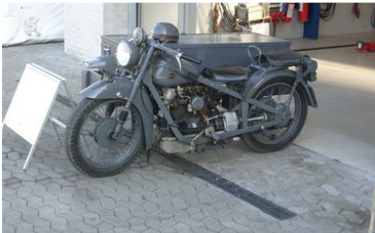
Nimbus C med sidevogn Nr.11999.