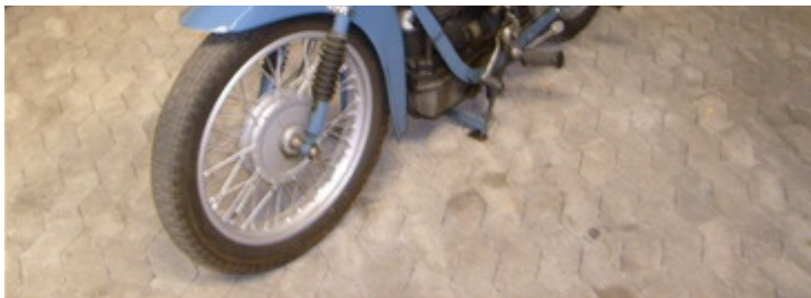
Nimbus model C Nr.B 20, løbenr. 474.