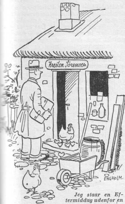
Jeg staar en Eftermiddag udenfor en lille, uanselig Butik ...

Jeg bli'r lidt lang i Ansigtet, men passer paa ikke at vise det. Jeg slaar til (efter at have regnet ud, at det kan betale sig for mig), og saa begynder vi at tale om Udkast til Manuskrift. Det bli'r den mest rodede Annonce,