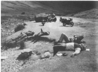
»De fem« i England