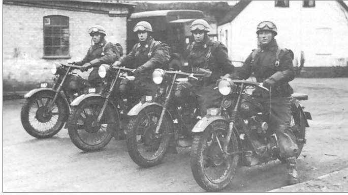
Fire menige af Trainafdelingens 1 vinterhold 1950/51 på motorcykel af mærket Nimbus. Fra Kilde 2.

Nimbus motorcyklen er af typen C, der blev fremstillet mellem 1934 og 1960.