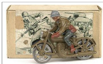
9007 Timpo US Army Dispatch Rider. Fra Timpo US Army men 1950-55 (Knights of Avalon).

Yderligere oplysninger om Reisler figurerne kan findes på Tonni Hansens hjemmeside Reisler modelfigurer .