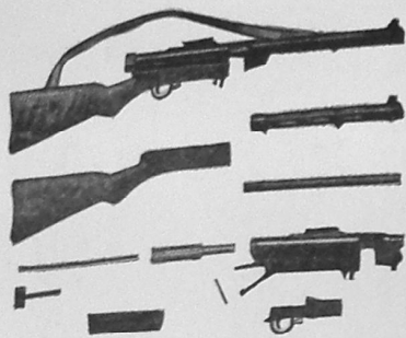
VOR HÆRS FINSKE MASKINPISTOL

»Suomi-Maskinpistol, som vejer ca. 5,5 kg med paasat 50 Skuds Magasin kan skyde 600-700 Skud pr. Minut. Øverst den samlede Pistol, derunder Pistolen adskilt i Overrør, Skofte, Pibe, Løsemekanisme og Aftrekermekanisme. Piben er fast. Løsevelens bevægelse af Krudtgassens Tryk. Bekylen bremses af fjederpaavirket Ventil. Længde 85 cm, Begyndelseshastighed 400 m/sek. Efter Billedet i »Folk og Værn«. — Fot. Folker.